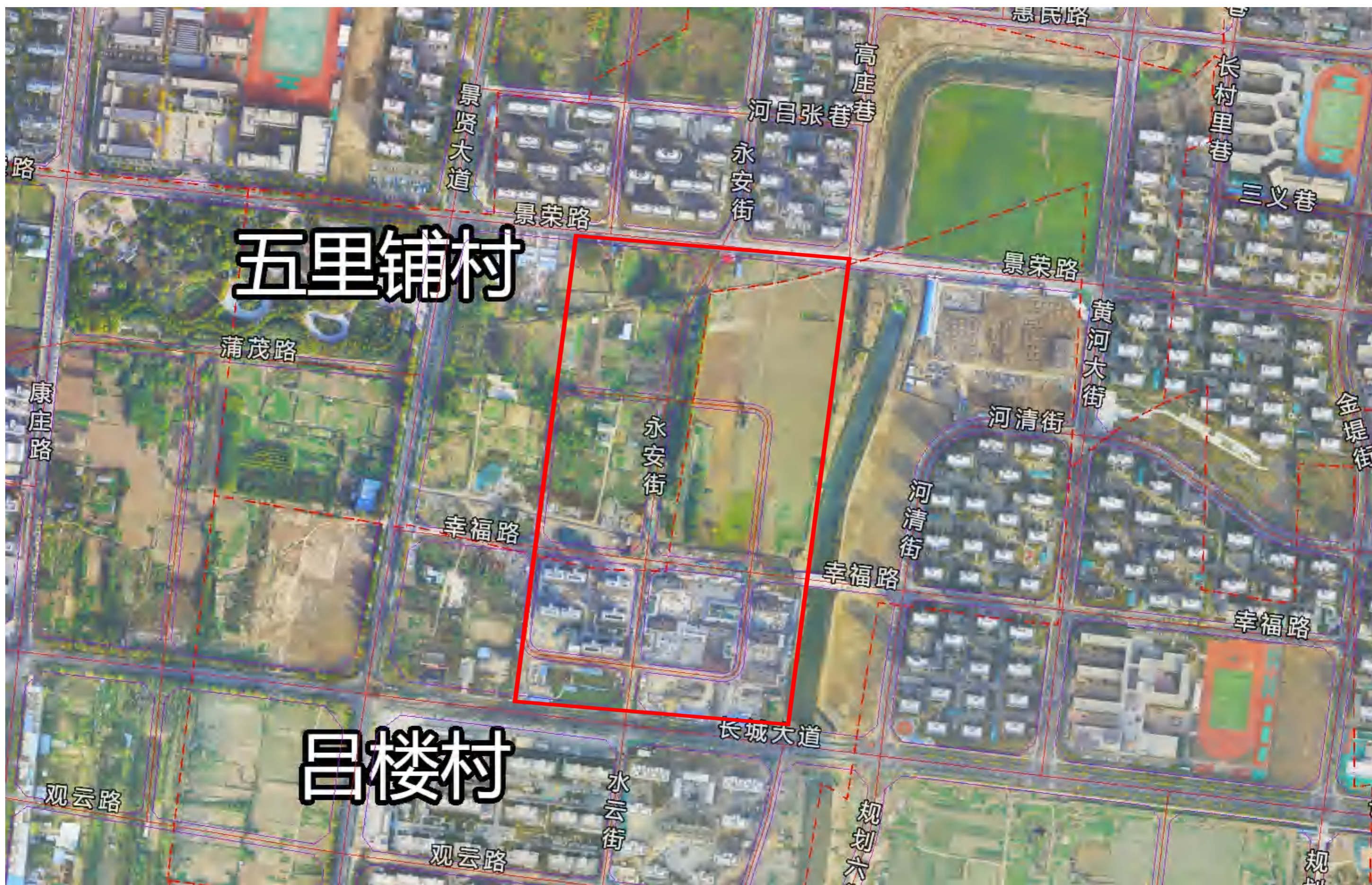
项目位于长城大道北侧、景贤大道以东，用地性质为二类居住用地，用地面积分别为30.68亩、36.67亩、29.72亩、18.09亩，南侧2块已建项目未进行调整。